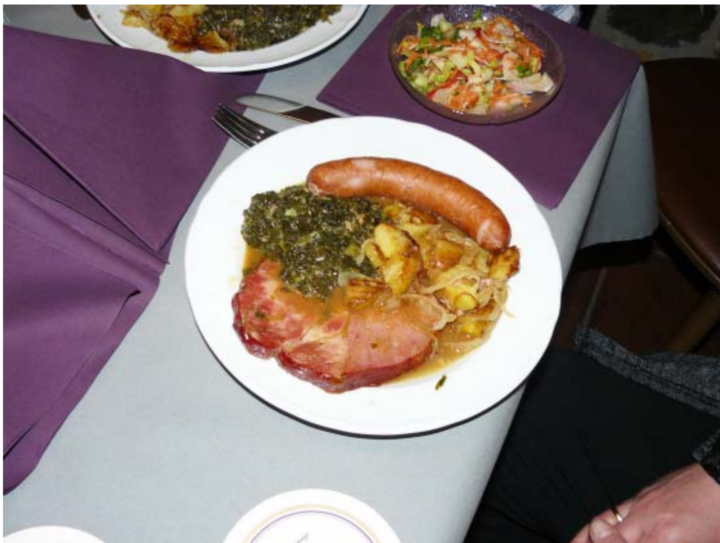
Grünkohlessen beim Heimatverein

Informationsschrift der örtlichen Vereine, Nr. 205, 3. Ausgabe 2016