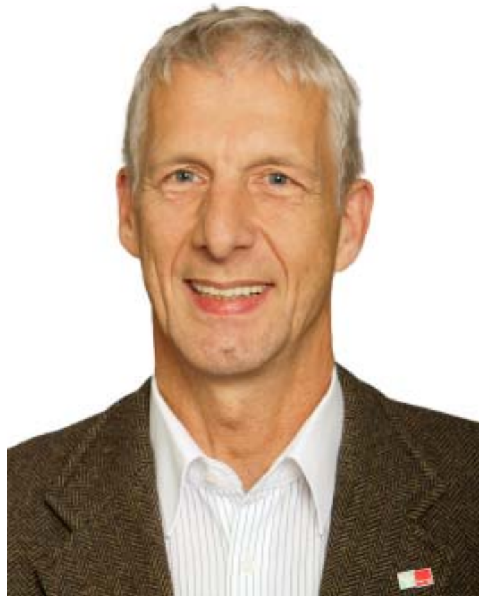
Herbert Behrens aus Osterholz-Scharmbeck - seit 2009 Abgeordneter im Deutschen Bundestag