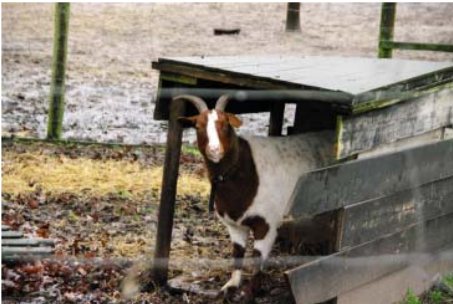
Manchmal ist „tier“ froh über ein Dach über dem Kopf

Informationsschrift der örtlichen Vereine, Nr. 156, 2. Ausgabe 2012